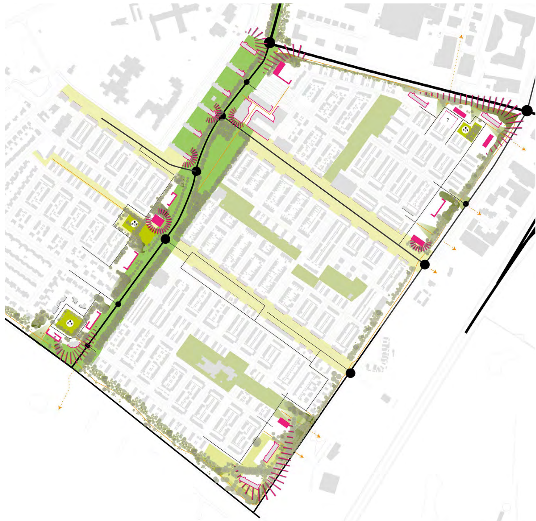
Structuurkaart gemaakt als onderdeel van de wijkstudie